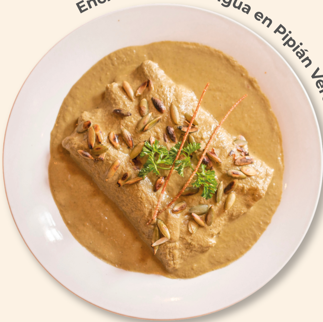
Enchiladas de Lengua en Pipián Verde

mezcla de insectos: xamues, chapulines, chinicuiles, gusano de maguey y escamoles, acompañados con salsa de chicatanas y guacamole.